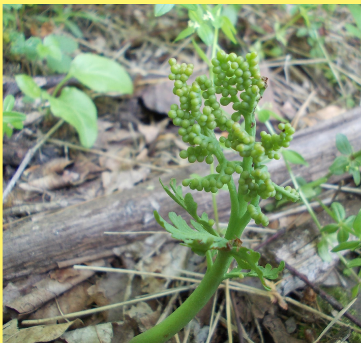
Podejźrzon marunowy