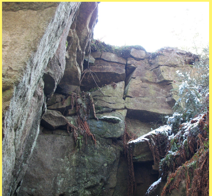
Skały Zamczysko

Najprostszym sposobem dotarcia do Zamczyska jest dojazd samochodem do kościoła w miejscowości Kocierz Rychwałdzki (bezpłatny parking), a następnie podejście 35-40 minut zielonym szlakiem w stronę szczytu Łysiny (kierunek: Wielki Gibasów Groń – Łamana Skała). Tutaj należy opuścić znakowany szlak i zagłębić się w lesie na południe od szlaku. Zamczysko jest położone zaledwie 100-150 metrów od szlaku, ale nie jest z niego widoczne. Ze względu na fakt, że cały kompleks skalny jest dość gęsto porośnięty przez drzewa i krzaki warto go zwiedzać wczesną wiosną, kiedy liście w niewielkim stopniu przysłaniają malownicze skałki.