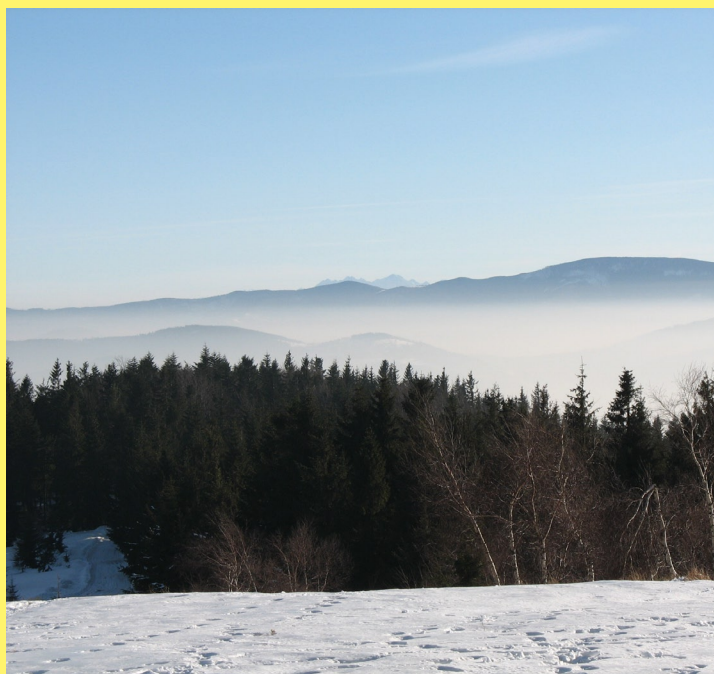
Widok z Leskowca w zimie