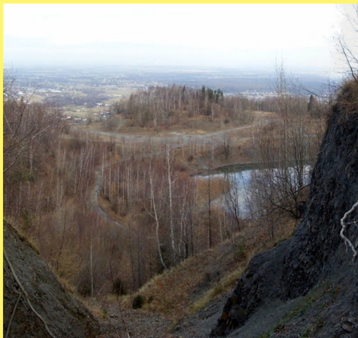
Kamieniołom w Kozach