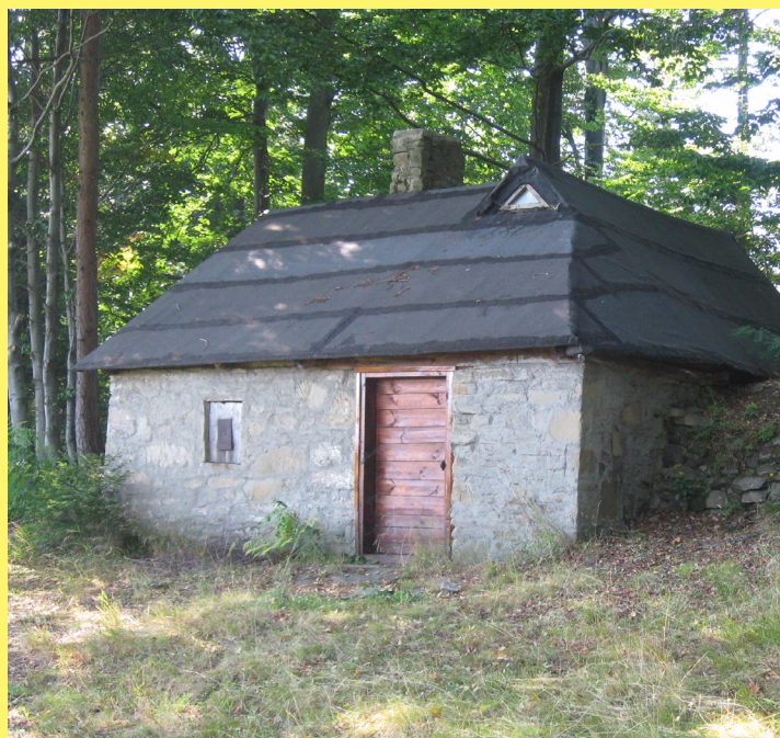
Szałas na Przykrzycy