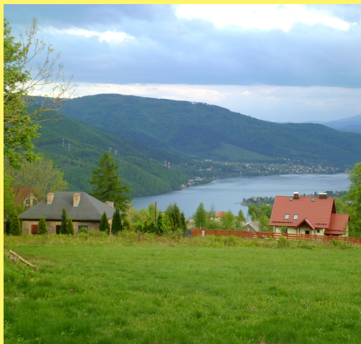
Jezioro Międzybrodzkie spod Hrobaczej Łąki

Jezioro Międzybrodzkie to sporych rozmiarów zbiornik zaporowy na rzece Sole. Powstał w 1937 roku, po wybudowaniu zapory „Porąbka”. Jego powierzchnia wynosi 3,8 km 2 . Jezioro to dzieli (a w zasadzie łączy) dwie części Beskidu Małego: wschodnią z pasmem Łamanej Skały (929 m n. p. m.) oraz zachodnią z pasmem Czupla (933 m n. p. m.) i Magurki Wilkowickiej (909 m n. p. m.). Nad taflą wody góruje szczyt Żaru (761 m n. p. m.), na którym umiejscowiony jest zbiornik wodny należący do elektrowni szczytowo-pompowej, która jest drugą co do wielkości w Polsce. Jezioro, położone na terenie Międzybrodzia Bialskiego, Żywieckiego i Czernichowa, pełni funkcję przeciwpowodziową i rekreacyjną. Można tutaj wypoczywać, pływać, wędkować, żeglować, korzystać z rowerów wodnych, kajaków itp. Ten niezwykle zbiornik na stałe wpisał się w krajobraz Beskidu Małego.