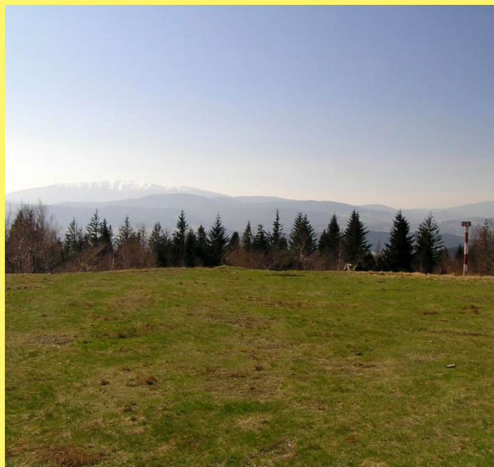
Widok z Leskowca w lecie

Szczyt Leskowca zwraca uwagę ze względu na wybitne panoramy roztaczające się z samego wierzchołka w kierunku wschodnim, południowym i południowo-zachodnim. Ze szczytu możemy dostrzec Beskid Żywiecki (z Babią Górą na czele), Beskid Makowski, Beskid Wyspowy, Gorce i Pogórze Wielickie. W pogodne dni widać stąd odległe o ok. 70 km Tatry. Zimowa panorama z Leskowca nie ma sobie równych w całym Beskidzie Małym.