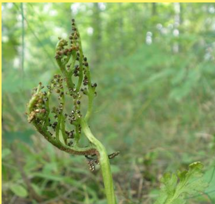
Podejźrzon marunowy