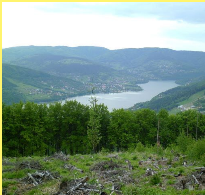
Jezioro Międzybrodzkie z Jaworzyny