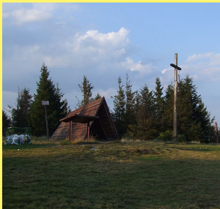
Wiata i krzyż na wierzchołku Leskowca