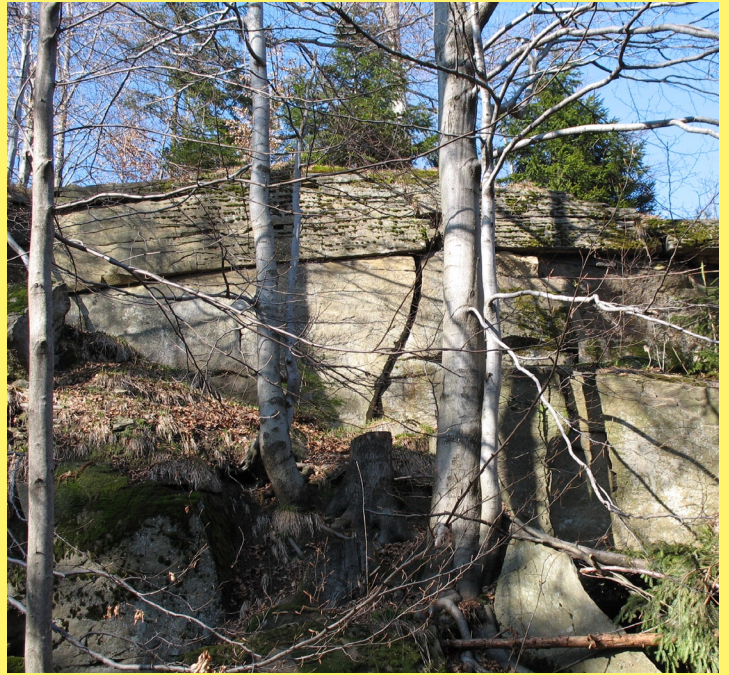
Skały Zamczysko

Zamczysko jest ciekawym kompleksem skalnym zbudowanym z piaskowca istebniańskiego, który jest położony na południowy wschód od szczytu Łysiny (Ścieszków Gronia, 779 m n. p. m.) w Beskidzie Małym (gm. Łękawica). Jego nazwa wiąże się z legendą o istniejącym kiedyś w tym miejsc zamku, który zapadł się pod ziemię, pozostawiając po sobie jedynie podziemny tunel. Skały Zamczyska uformowane są w fantazyjne bloki i grzyby, tworzą też szereg krótkich i wąskich, ale bardzo malowniczych wąwozów, a najwyższe ze ścian osiągają kilkanaście metrów wysokości. Część z tych pięknych skał wzbudziła zainteresowanie wśród wspinaczy, którzy założyli tutaj ringi i wyznaczyli kilkanaście dróg wspinaczkowych o trudności od IV do VI.4+.