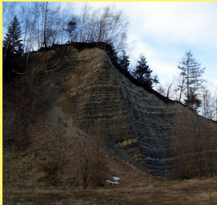
Kamieniołom w Kozach