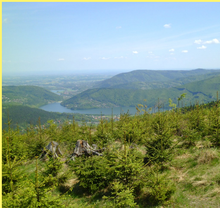
Jezioro Międzybrodzkie z Czupla