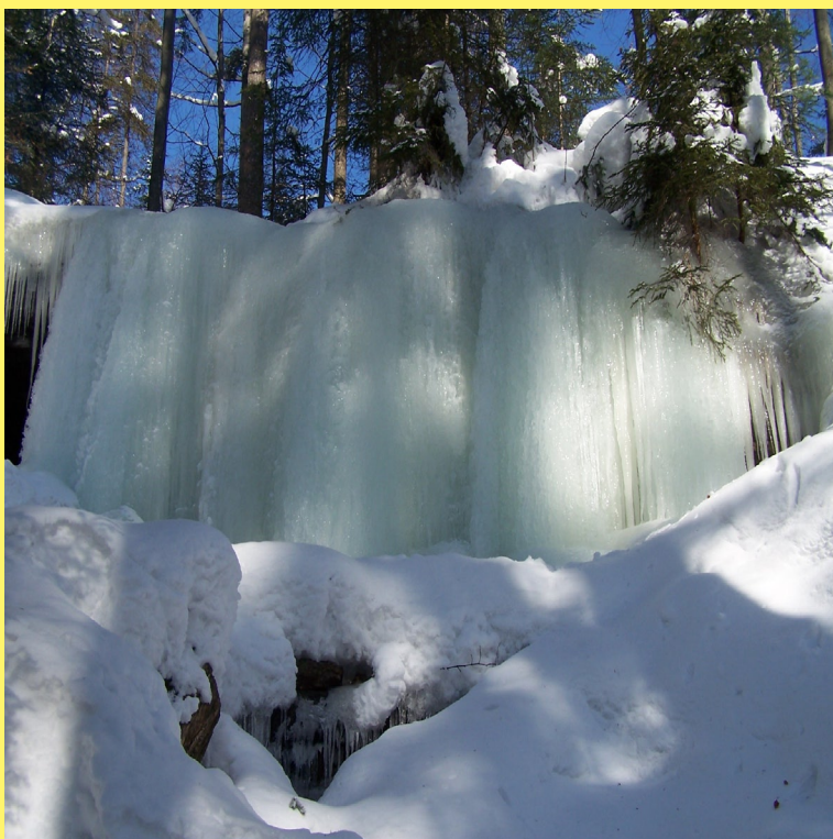
Grota Komonieckiego zimą