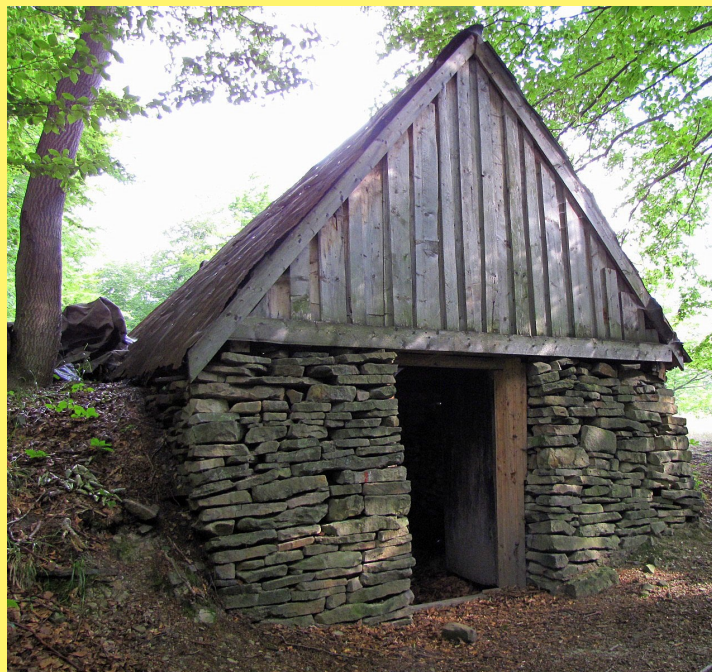
Szałas na Polanie Cinalkowej

Wykorzystanie szałasów kamiennych na terenie Beskidu Małego wiązało się z indywidualną gospodarką polaniarską, a nie z organizowanym wypasem szałasniczym na halach. W Beskidzie Małym w odróżnieniu od innych terenów beskidzkich rzadko powstawały typowe szałas – zespoły zabudowań na halach, gdzie pasterze bytowali cały sezon, gdyż ten typ gospodarki był nieopłacalny ze względu na małe odległości od domostw w tutejszych wsiach. Na polanach górskich stawiano oryginalne budowle kamienne lub drewniane, które były raczej szopami polaniarskimi niż szałasami i fachowo powinno się je nazywać: letniakami, stajniami letnimi, kolybami lub szopami. Jednakże przez wzgląd, iż budowle te od dawna interesowały badaczy kultury ludowej w literaturze (Leszczycki, Sosnowski) zostały przez nich nazwane jako „szałas kamienne w Beskidzie Małym”.