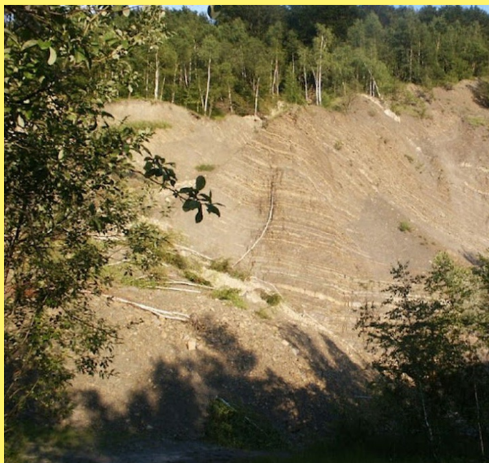
Kamieniołom w Kozach

Kamieniołom w Kozach jest miejscem występowania kilku gatunków chronionych i zagrożonych wyginięciem storczyków oraz jedyne stanowiska w Beskidzie Małym chronionego skrzypta pstrego i zarazy drobnokwiatowej (źródło: D. Tlałka). Widoczne warstwy geologiczne na odsłoniętych urwiskach są okazją do nietypowej lekcji geologii. Jeżeli będziemy poruszać się cicho i dopisze nam szczęście z pewnością spotkamy tu zajęce, sarny z kozłętami, kumaka górskiego czy zaskrońca, a ptaki umilą nam pobyt pięknym śpiewem.